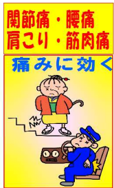
筋肉痛・腰痛 肩こり・関節痛