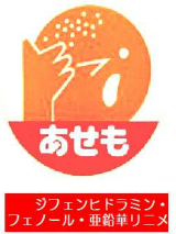
アセモリニメント