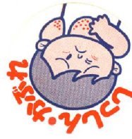
しっしん・かぶれ