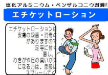
エチケッソーション